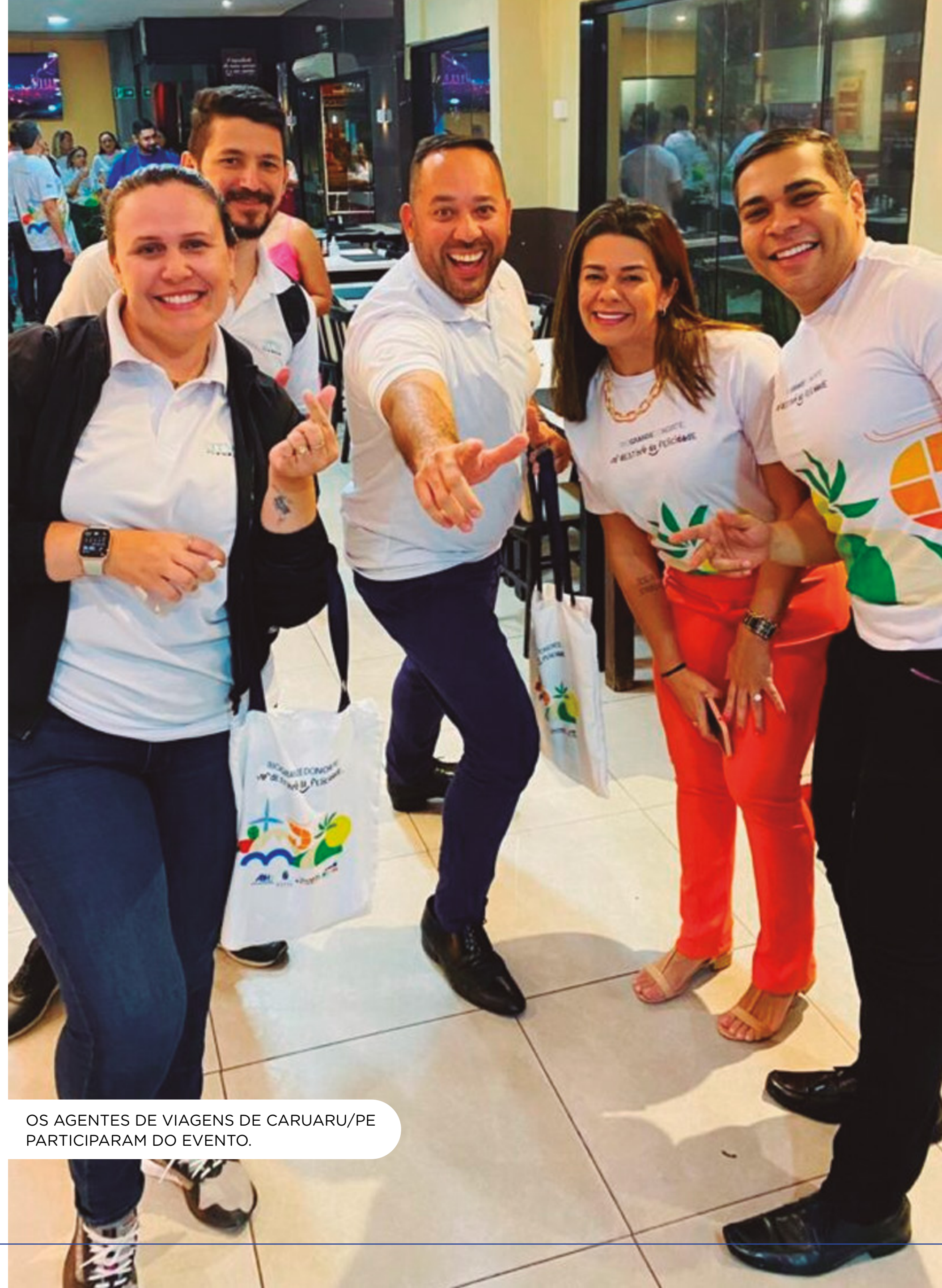
OS AGENTES DE VIAGENS DE CARUARU/PE PARTICIPARAM DO EVENTO.