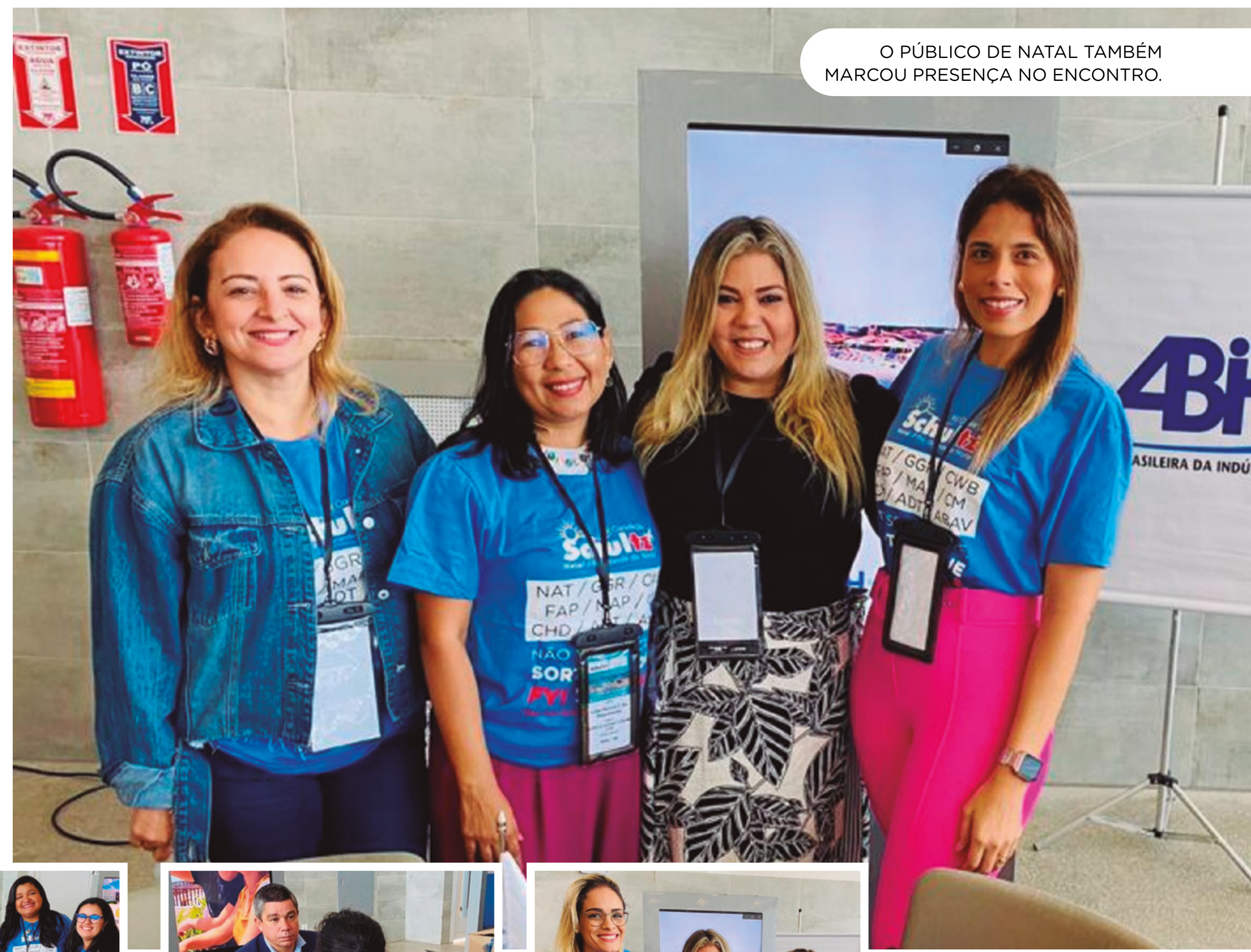
O PÚBLICO DE NATAL TAMBÉM MARCOU PRESENÇA NO ENCONTRO.