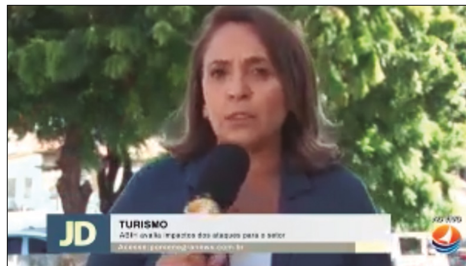
JORNAL DO DIA: HTTPS://WWW.YOUTUBE.COM/WATCH?V=PG9YZFJ8FUY&t=4S