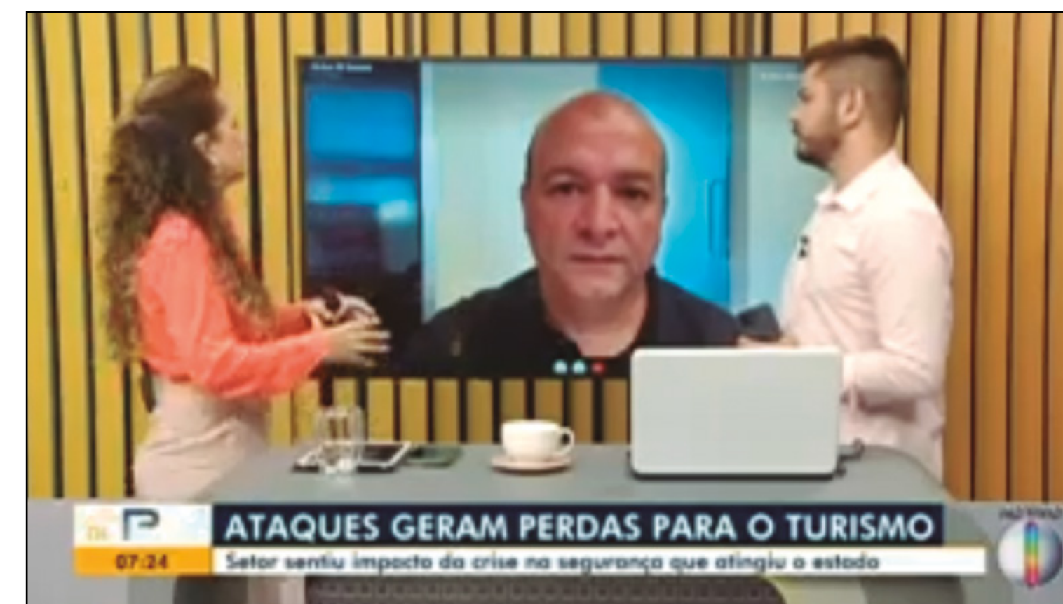
BOM DIA RN: HTTPS://WWW.YOUTUBE.COM/WATCH?V=KH76OEXVMFY&t=4S