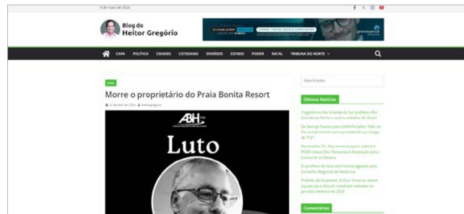
MORRE O PROPRIETÁRIO DO PRAIA BONITA RESORT: https://blog.tribunadonorte.com.br/heitorgregorio/morre-o-proprietario-do-praia-bonita-resort/