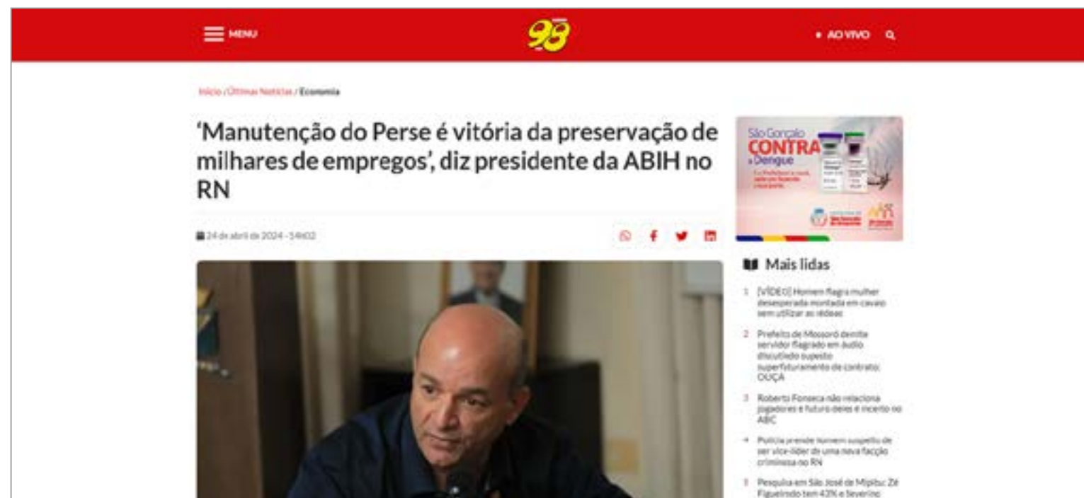
'MANUTENÇÃO DO PERSE É VITÓRIA DA PRESERVAÇÃO DE MILHARES DE EMPREGOS', DIZ PRESIDENTE DA ABIH NO RN: https://98fmnatal.com.br/ultimas/manutencao-do-perse-e-vitoria-da-preservacao-de-milhares-de-empregos-diz-presidente-da-abih-no-rn/