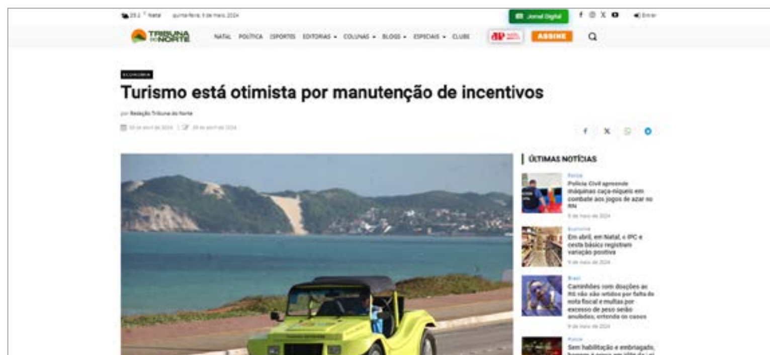
TURISMO ESTÁ OTIMISTA POR MANUTENÇÃO DE INCENTIVOS: https://tribunadonorte.com.br/economia/turismo-esta-otimista-por-manutencao-de-incentivos/