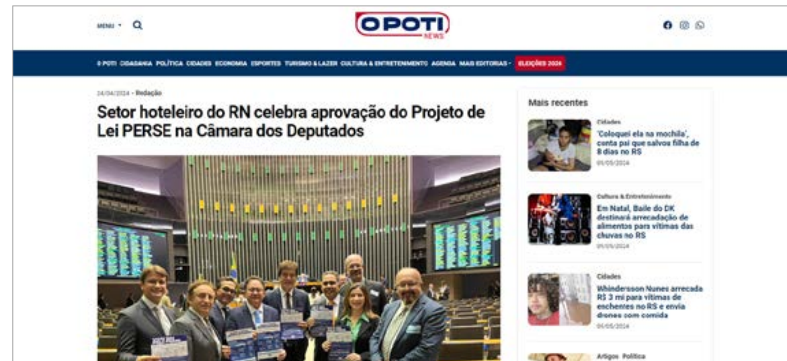
SETOR HOTELEIRO DO RN CELEBRA APROVAÇÃO DO PROJETO DE LEI PERSE NA CÂMARA DOS DEPUTADOS: https://www.rn.gov.br/materia/governo-apresenta-projetos-para-ampliar-turismo-em-apodi-felipe-guerra-e-sitio-novo/