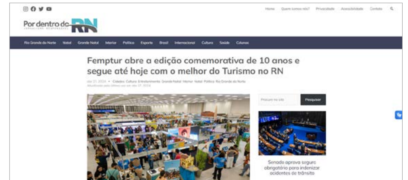
FEMPTUR ABRE A EDIÇÃO COMEMORATIVA DE 10 ANOS E SEGUE ATÉ HOJE COM O MELHOR DO TURISMO NO RN: https://pordentrodorn.com.br/2024/04/27/femptur-abre-a-edicao-comemorativa-de-10-anos-e-segue-ate-hoje-com-o-melhor-do-turismo-no-rn/