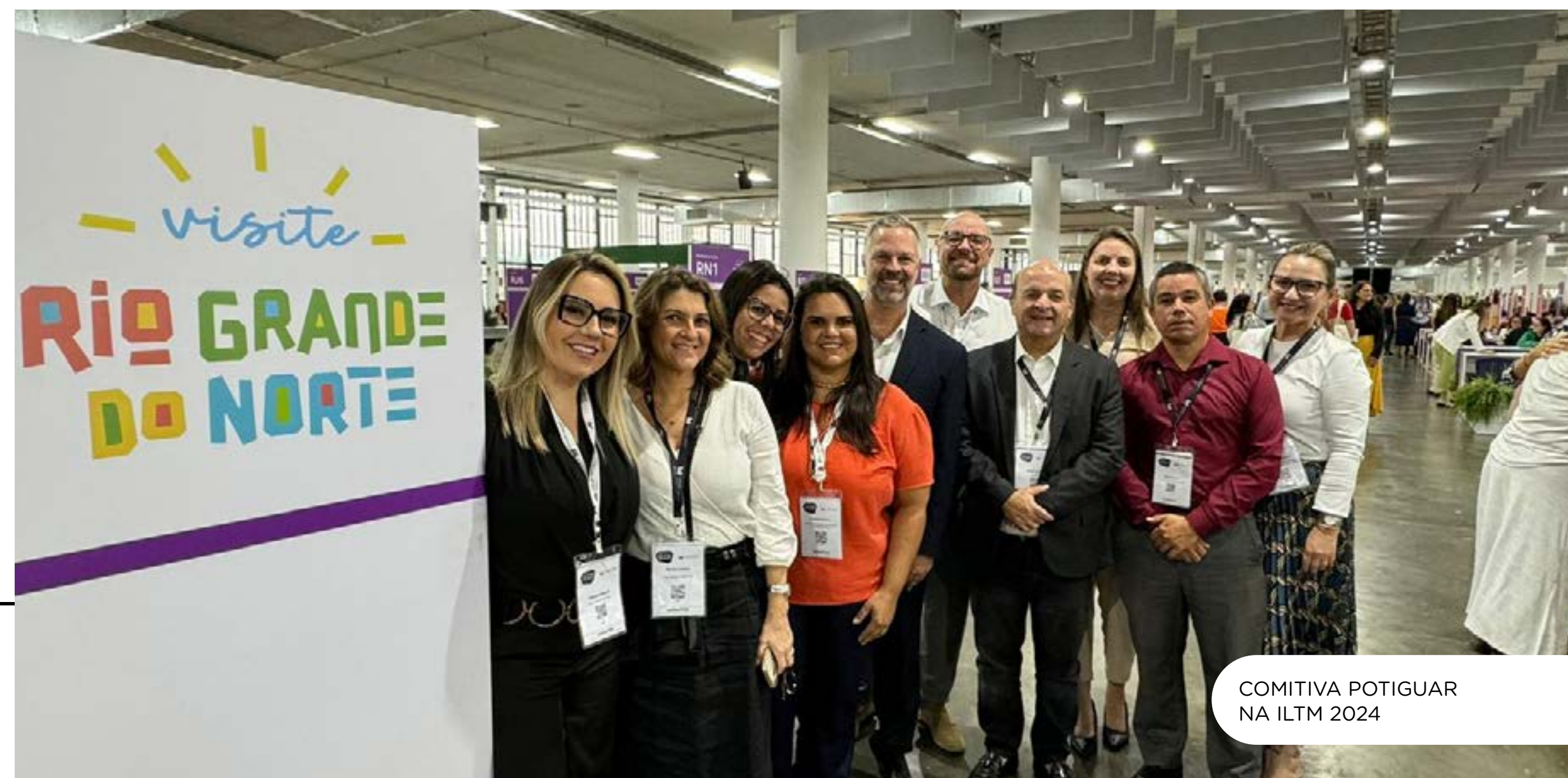
COMITIVA POTIGUAR NA ILTM 2024

Na ocasião, a ABIH-RN e SETUR, ofereceram um jantar para 20 agentes de viagens do segmento luxo. A ação de divulgação e promoção do destino RN, aconteceu no dia 08 de maio, no Restaurante Président do chef Érick Jacquin.