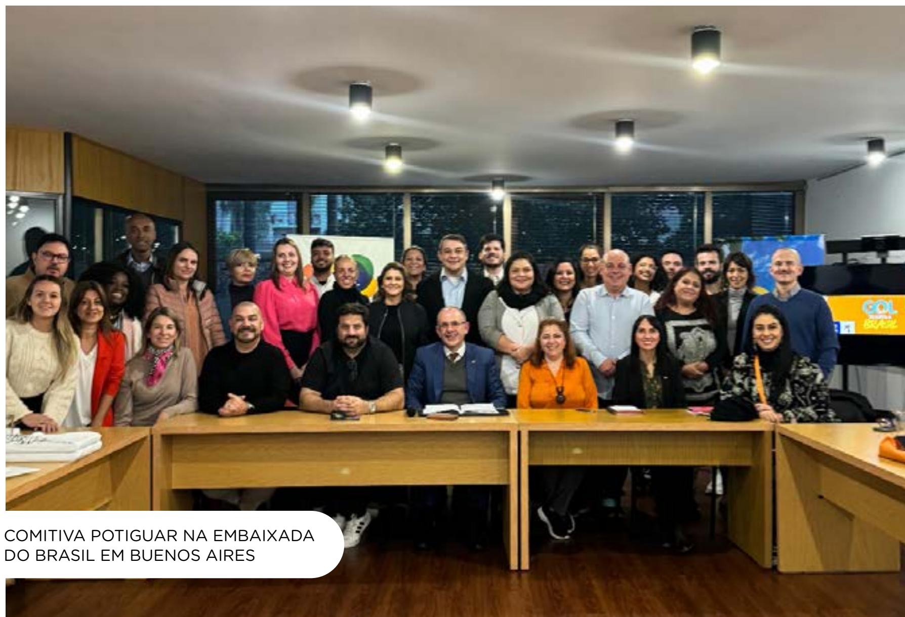
COMITIVA POTIGUAR NA EMBAIXADA DO BRASIL EM BUENOS AIRES