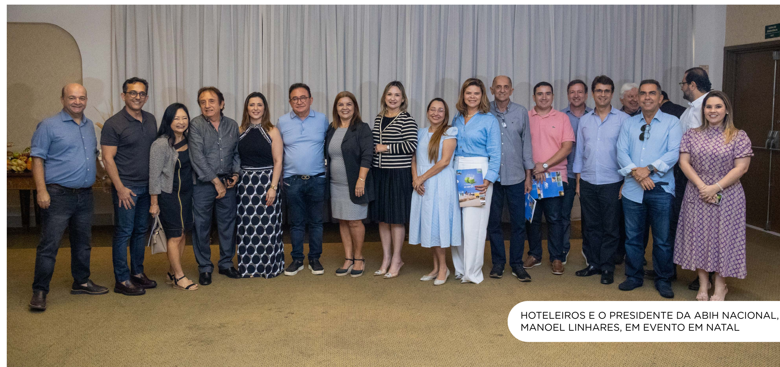
HOTELEIROS E O PRESIDENTE DA ABIH NACIONAL, MANOEL LINHARES, EM EVENTO EM NATAL